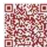
Spenden für neue Stühle