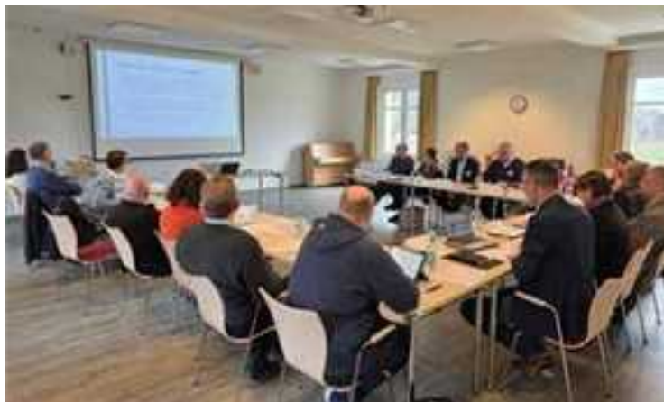
Die Lenkungsgruppe arbeitet an der Gründung eines neuen Kirchenkreises.

Um die anstehenden Themen zu bearbeiten, wurde eine Lenkungsgruppe eingesetzt, die die planerische (Vor-)Arbeit übernommen hat. Zu dieser Gruppe gehören die Superintendenten des KK Lüneburg, die Pröpstin des KK Uelzen und die stellv. Superintendentinnen des KK Lüchow-Dannenberg. Außerdem arbeiten die Kirchenamtsleitungen, Vertreter:innen der Kirchenkreisvorstände, der Synodenpräsidien und der Mitarbeiter:innenvertretungen mit. Die Lenkungsgruppe hat die Arbeit aufgenommen. Als Erstes wird die Fusion der Kirchenämter angestrebt.